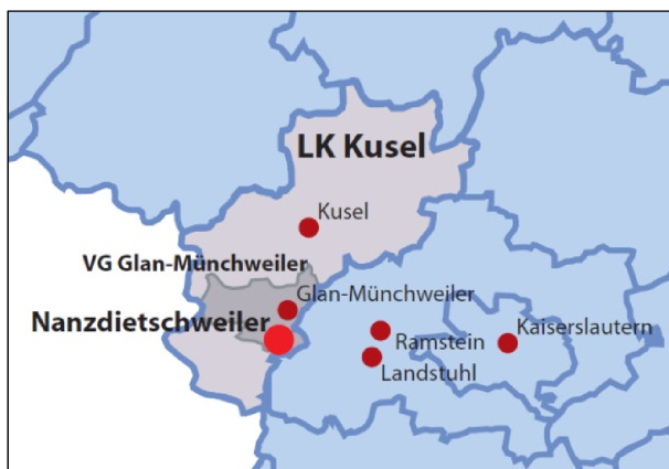
Abb. 2: Lage der Ortsgemeinde Nanzdietschweiler in Rheinland-Pfalz