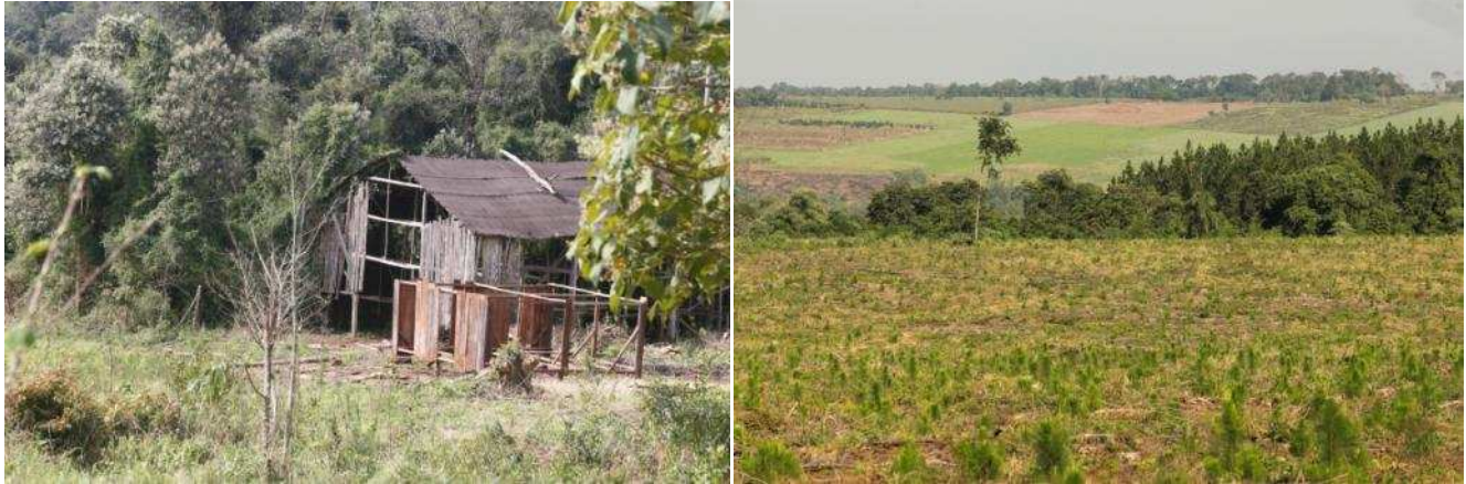
Secadero de tabaco (izquierda) y plantación de pinos sobre lo que antes era selva nativa.

Las 14 familias de la aldea que conforman esta comunidad sobreviven acorraladas por cientos de hectáreas de plantaciones de pinos y tabaco que, hace poco más de 10 años, remplazaron las selvas que fueron su hogar.