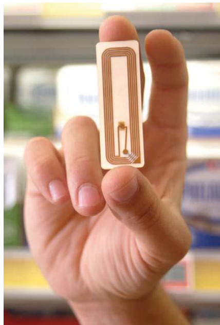
Figura I. Rótulo RFID

La RFID promete introducir un cambio en ese paradigma informático, de modo tal que, en el futuro, no sólo las personas y sus dispositivos de comunicación estarán conectados a redes mundiales, sino que también lo estará un gran número de objetos inanimados, desde neumáticos hasta navajas de afeitar. Las aplicaciones de la RFID permitirán la compilación automática y autónoma de datos sobre todas las cosas que vemos y utilizamos en nuestro entorno, creando de ese modo, espacios de red verdaderamente inteligentes y ambientales.