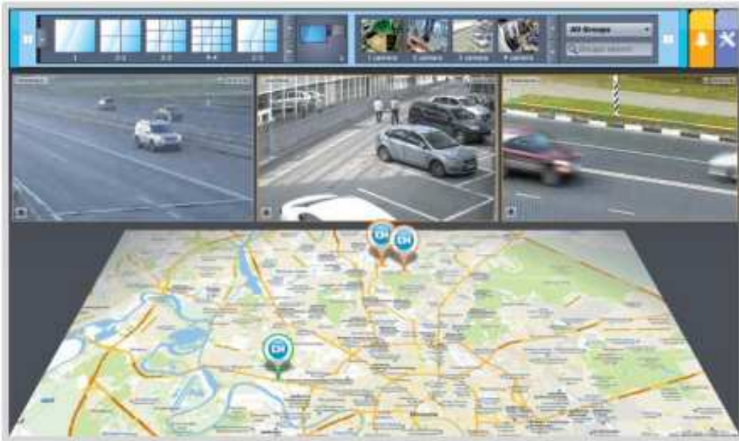
Ejemplo de Integración de software VMS con Google Maps. * extraído del sitio oficial de AxxonSoft.

Como puede observarse, los sistemas VMS (Video Management Systems) son potentes desarrollos de software, que poseen gran escalabilidad, y funcionalidad avanzada, fácil interacción con el usuario que opera el sistema, y sobre todo, gestionan eventos que provienen de dispositivos IP's o analógicos que se encuentran integrados al sistema. Los Sistemas VMS gestionan los eventos, y los utilizan para realizar acciones específicas con ellos. Esas acciones específicas abarcan desde enviar un simple email, hasta capturar fotos y activar o desactivar relés.