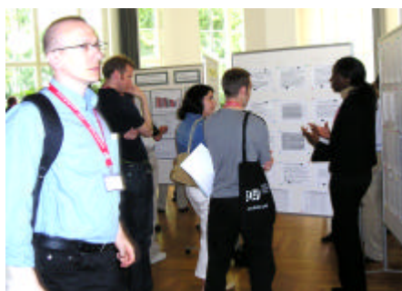
The SOEP2004 Poster Presentation was well attended. The discussions were intense and animated. Abstracts from the posters can be downloaded from: