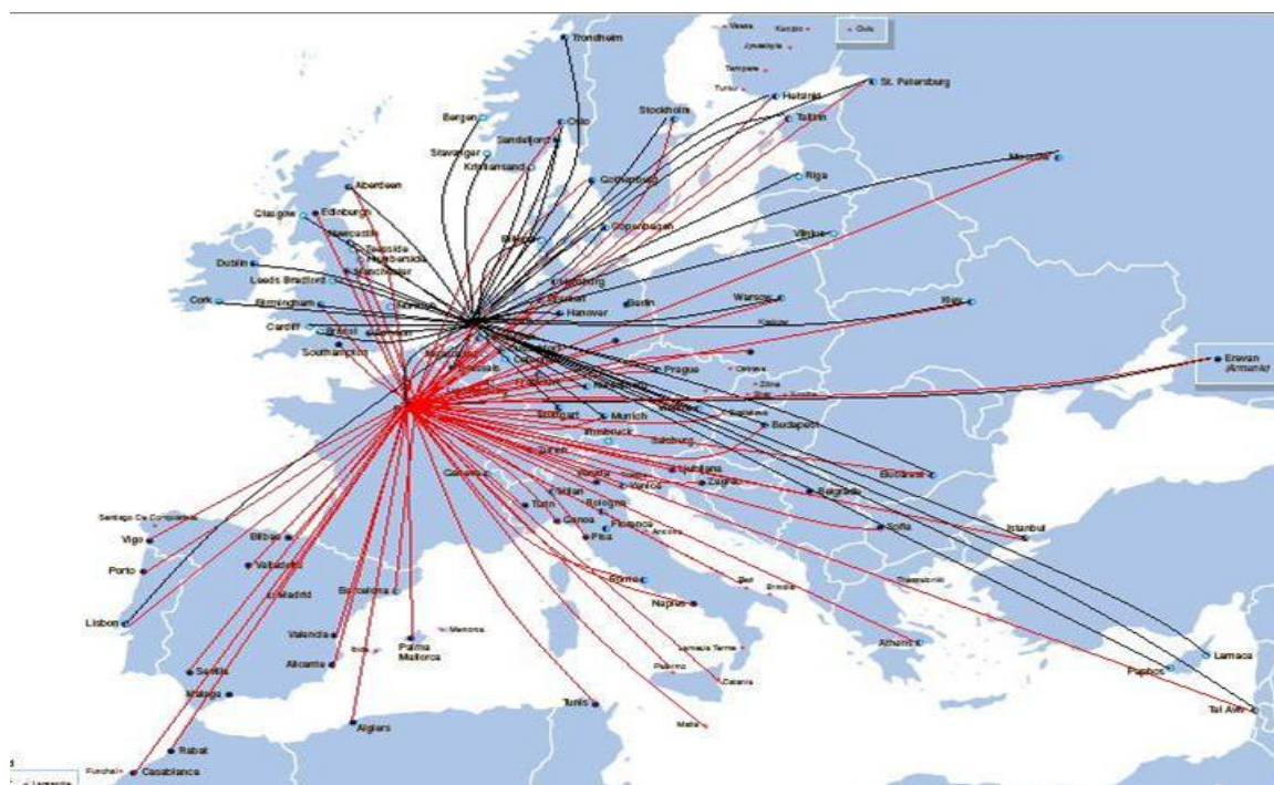
Figure 2. Réseau fusionné d'Air France et de KLM : Paris et Amsterdam

En résumé, la position dominante dans un aéroport permet à un transporteur de profiter de l'avantage du pivotage et d'autres atouts connexes. 18 Les compagnies aériennes préfèrent disposer en exclusivité de leur propre aéroport pivot et ne pas partager de plaque tournante avec un autre transporteur aérien. Les transporteurs peuvent mettre en place un réseau optimal comportant plusieurs pivots pour la desserte continentale, mais ils n'ont pas les moyens de disposer de plus d'un pivot dans une même région. L'analyse de tous ces facteurs amène à formuler les observations suivantes :