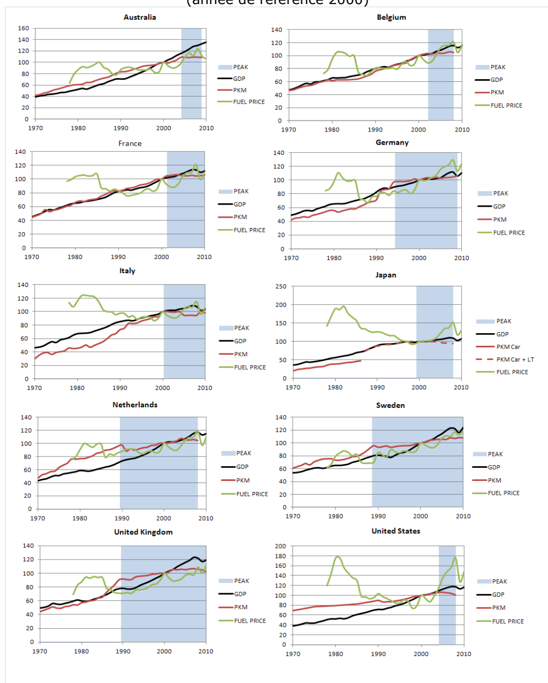
Graphique 2. Évolution du PIB, des prix des carburants et des voyageurs-kilomètres (vkm) dans 10 économies à revenu élevé, 1970-2010 (année de référence 2000)

Source : Les voyageurs-kilomètres sont calculés à partir de données sur les déplacements en véhicules privés issues des statistiques du FIT, de données des États-Unis estimées pour les points de données manquants antérieurs à 1990 ; les données sur le Japon tiennent compte des véhicules utilitaires légers (lignes en pointillés) ou les excluent (lignes pleines) ; l'indice des prix des carburants se compose de la moyenne pondérée par le volume des prix de l'essence et du diesel extraits des Energy Prices and Taxes de l'AIE, et des volumes issus de la base de données de l'AIE sur la modélisation de la mobilité, pour le Japon, seul un indice des prix de l'essence est utilisé ; les données du PIB proviennent des Comptes nationaux de l'OCDE et sont exprimées en USD constants de 2005 en PPA ; les zones ombrées représentent une période qui, d'après la régression examinée à l'encadré 1, a connu un changement structurel au niveau des déplacements en véhicules privés.