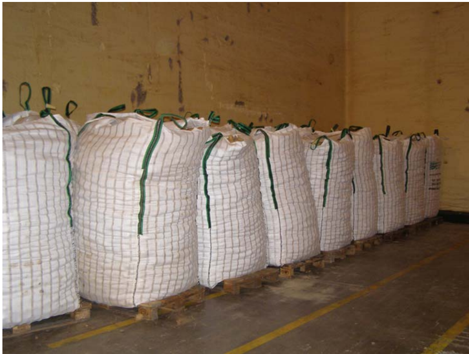
Körte hűtőtárolóban, Vilodi Fruit