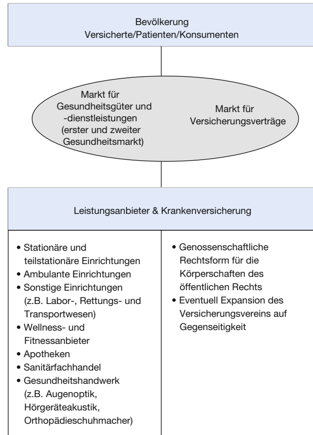
Abbildung 2 Versicherungen als Gesundheitsgenossenschaften

Aus der Abbildung 1 ist für das Beispiel eines Versorgungsnetzes zu erkennen, dass es einer Managementgesellschaft bedarf, die die erkrankten Versicherten besser führt und versorgt als es im Status quo der Fall wäre. Ohne die Einzelheiten dieses Netzwerks mit seinem Nutzen und den Wettbewerbsvorteilen am Markt, die Kompetenz der Netzwerkgründer, des Management-Teams und der Leistungsanbieter zu erörtern wird deutlich, dass unter der Voraussetzung, dass die Ertragsvorschau Überschüsse verspricht, die die Investitionskosten deutlich überschreiten, die zu gründende Managementgesellschaft eine zweckmäßige Rechtsform benötigt, um ihre Ziele zu verwirklichen. Hier konkurrieren dann im Rechtsvergleich GmbHs, Genossenschaften, Gesellschaften bürgerlichen Rechts oder Aktiengesellschaften und die Limited miteinander. Es wird sich im Wettbewerb zwischen den Krankenkassen und den Leistungsanbietern