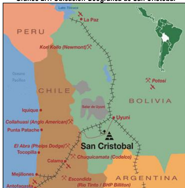
Gráfico 2.1: Ubicación Geográfica de San Cristóbal

Fuente: Extraído de www.coelsa.com (Proyecto Minero San Cristóbal).