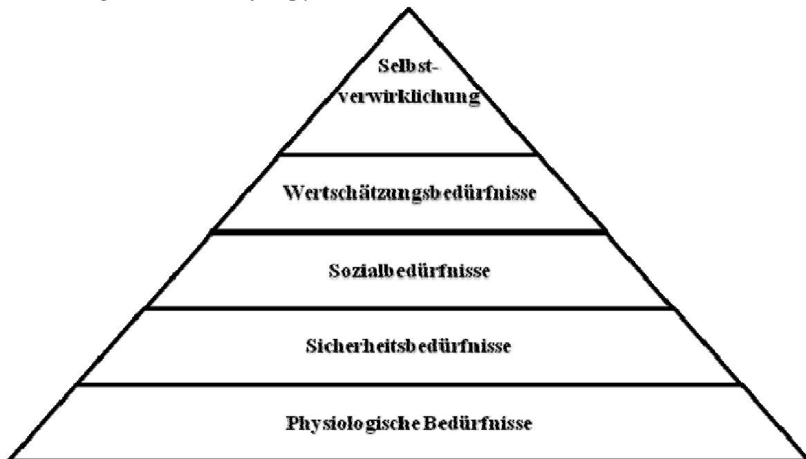
Abbildung 2: Die Bedürfnispyramide nach Abraham Maslow

Als Begründer der humanistischen Psychologie unternahm Abraham Maslow einen alternativen Versuch der Klassifikation von Motiven. Grundannahme dabei bildet die Fähigkeit des Menschen zu wertgeladener Selbstverwirklichung. Dementsprechend entwickelte Maslow fünf Bedürfnisklassen, die er in einer wertbezogenen Hierarchie entsprechend ihrer Rolle in der Persönlichkeitsentwicklung ordnete, wie Abbildung 2 grafisch darstellt (Scheffer, D./ Heckhausen, H.: 2010, S. 57).