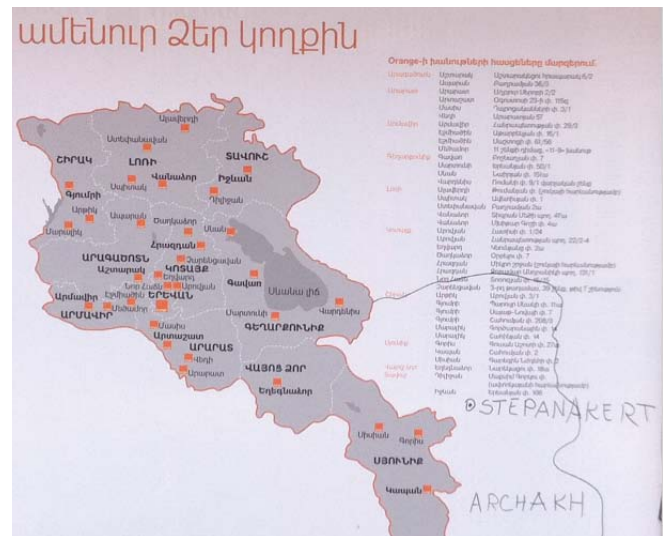
Die Grenzen der Bushaltestellenwerbung. Geopolitische Nachhilfe für den Orange-Konzern.

was letztlich bedeutet, dass die Republik Armenien von Angehörigen eines Staates regiert wird, den sie nicht anerkennt.