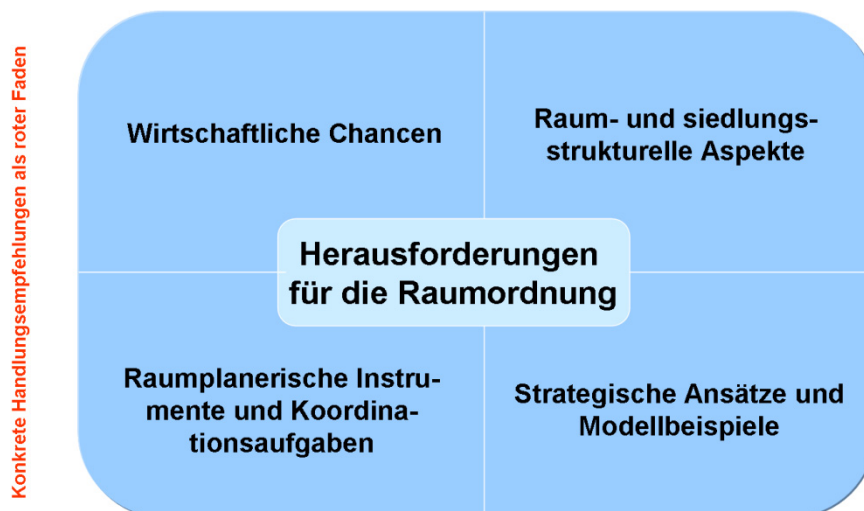
Abb. 2: Strukturelle Gliederung der Beiträge

An dieser Stelle werden die raumrelevanten Aspekte dieser komplexen Thematik umrissen und die wichtigsten Handlungsfelder für die Raumordnung dargestellt.