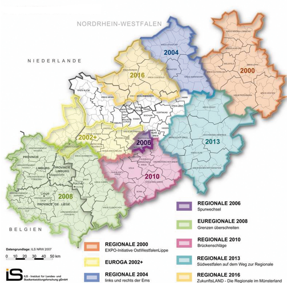
Abb. 1: Die REGIONALEN 2000 bis 2016 in Nordrhein-Westfalen