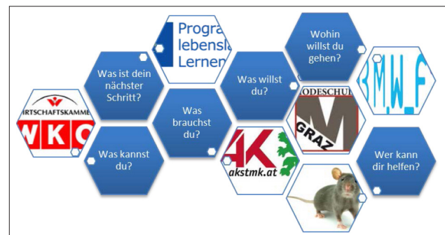
Grafik 2: Ablauf auf der individuellen Ebene