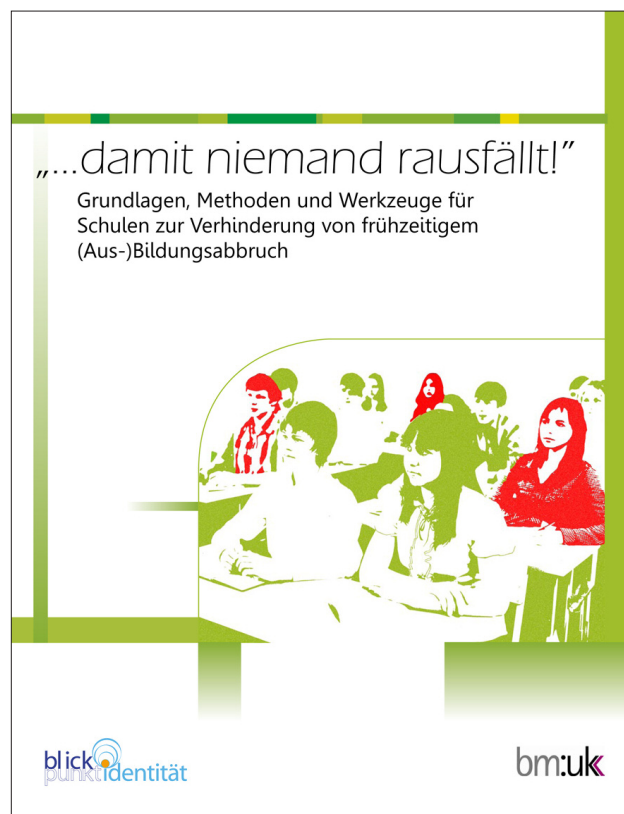
Abbildung: Publikation »... damit niemand rausfällt!«

Die Erfahrungen und Erkenntnisse, die in der Arbeit mit Stop Dropout! gewonnen wurden, sind in die Entwicklung von Handlungsempfehlungen für LehrerInnen und SchuldirektorInnen eingeflossen, die der Verein »Blickpunkt Identität« im Auftrag des BMUKK (nunmehr: BMBF) verfasst hat.