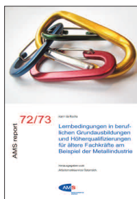
AMS report 72/73 Karin da Rocha Lernbedingungen in beruflichen Grundausbildungen und Höherqualifizierungen für ältere Fachkräfte am Beispiel der Metallindustrie