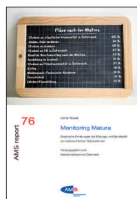
AMS report 76 Günter Nowak Monitoring Matura

Empirische Erhebungen zur Bildungs- und Berufswahl von österreichischen MaturantInnen